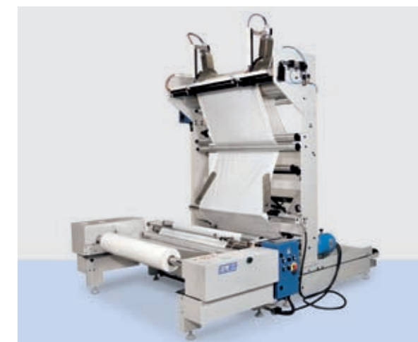
Portabobina semplice con monopiegatore, risvolto patella e saldatura continua ad aria calda. Simple unwinder with single-fold, film reverse and continuous hot air welding.