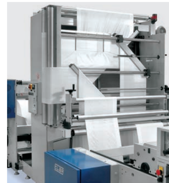
Deviatore piste per doppia raccolta Wicket, partendo da film tubolare. Film deviator for double Wicket collection, starting from tubular film.